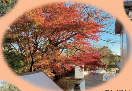
勿来関文学歴史館