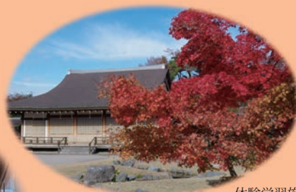
体験学習施設 吹風殿