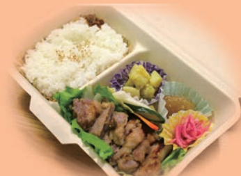
交流スペース勿来(なっくる)お弁当