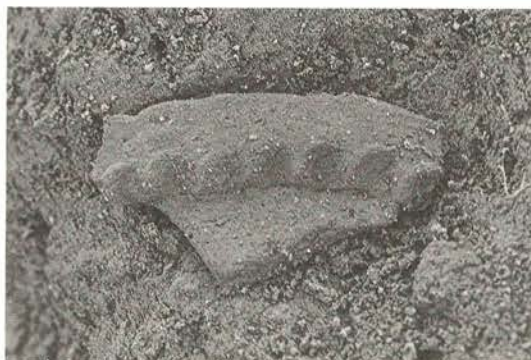
弥生時代後期の壺の破片

遺跡は、平中山字小山地内に所在し、周辺は滑津川に向かって南に延びる小丘陵に沢が入り込む地形を呈し、沢地には小山作堤が作られています。その幾分奥まった南丘陵上に小山遺跡があります。調査は、尾根と北東斜面にあるわ