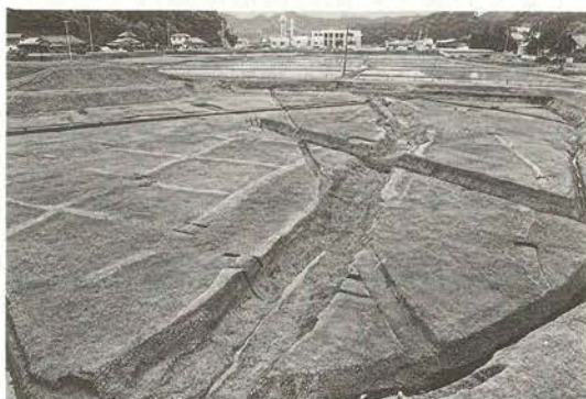
平安時代頃の水田跡（左岸）

平安時代頃（約1,200年前）の水田跡は、滑津川の両岸より見つかりました。一辺の長さが6M程の方形で、区画性を持っていることがわかりました。現在の水田に少しづつ近づいて来ていることがわかるといえます。水田跡と共に大小の溝跡も見つかっています。これらは給排水に利用されたものと考えられます。