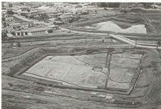
平安時代頃の水田跡（右岸）

耕作していた人々がどこに住んでいたのか等まだわからないところもありますが、当地区の古代史の一端を伺い知ることができました。