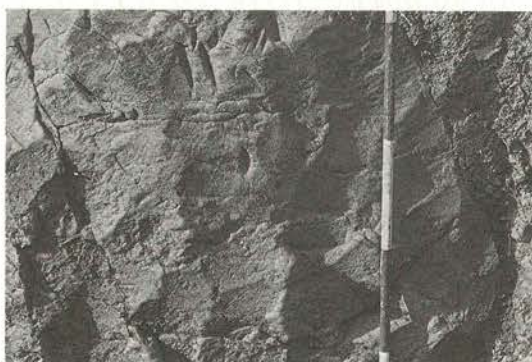
竪穴住居跡を掘った工具の跡