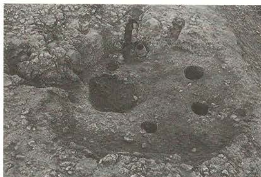
竪穴住居跡（2号竪穴住居跡）