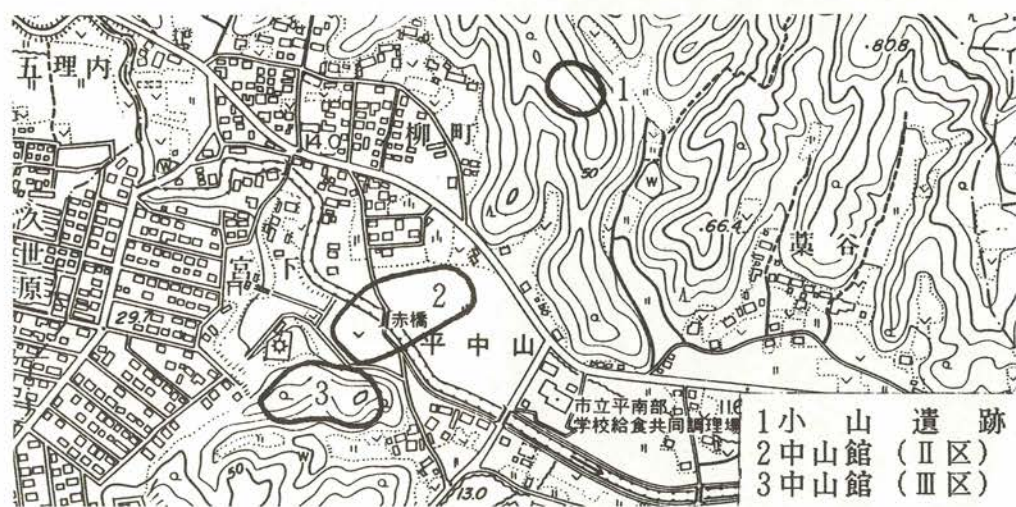
小山遺跡と中山館の位置（一万分の一地形図原寸使用）

小山遺跡では、奈良・平安時代の竪穴住居跡が3棟見つかっています。中山館のⅡ区では、中世の建物跡や平安時代とさらにそれより古いと思われる水田の跡が見つかり、古くから稲作が行われていたことがわかりました。同じくⅢ区では、丘陵の上に10棟もの中世の建物跡や柵列が見つかり、また、敵を防ぐため、地形的に様々な工夫がされていることがわかりました。