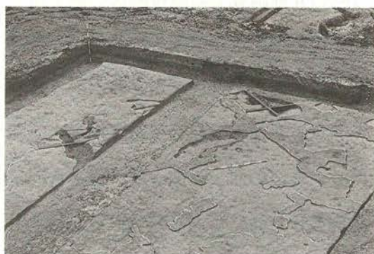
平安時代より古いと思われる水田跡

右岸（滑津川下流に向かい右手）から発見された平安時代より古い水田跡は、現在の水田面から約1m下にありました。耕作面積はとて小さく（約1㎡～4㎡）、形も不定形なものです。しかし、畔を作り水口を持つ水田の形態は、現在の水田と同じであることがわかりました。