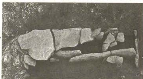
第6図 古墳時代のお墓（箱式石棺）