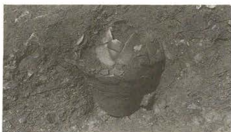
第5図 弥生時代のお墓（土器棺）

時代のお墓は、大きめのつぼやかめの中に骨を入れて土の中に埋めます。古墳時代のものは、板石を組み合わせて作った箱式石棺で、直接人間を埋葬するものです。一般には、古墳の中に埋まっているものです。