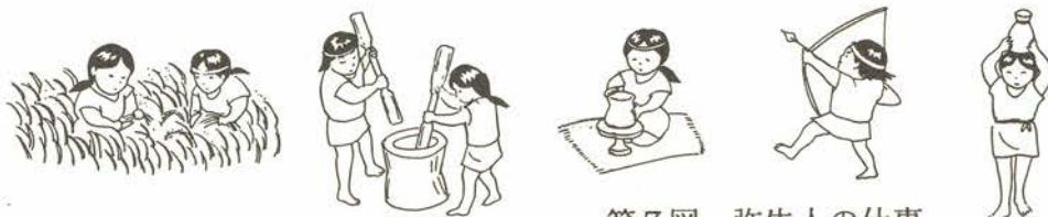
第7図 弥生人の仕事

下のイラストは、弥生人のようすです。米をつくる人、米をつく人、土器をつくる人、狩りをする人といろいろな仕事があります。