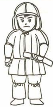
よろいをきた男の子 第8図

えます。大がかりな土木工事をおこない、頂上や斜面などに曲輪と呼ばれる平場を作ります。平場には建物をたてたり、柵をめぐらしたりします。また堀を作ったり土を盛るなどして敵の侵入に備えました。